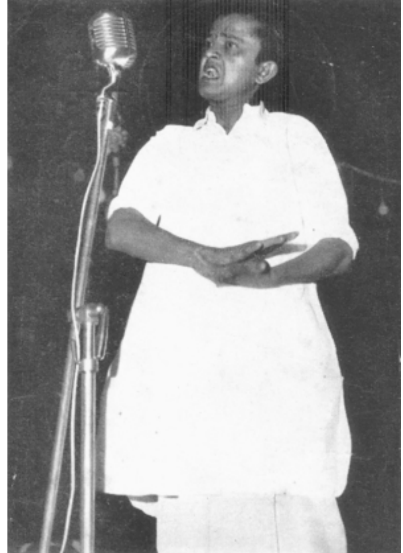
উন্টোরথের ফাংশনে: ১৯৫৪