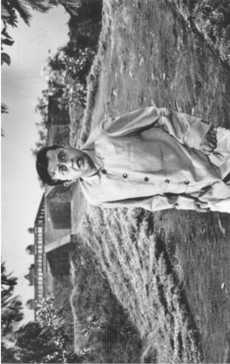
ছবিতে ভানু বন্দ্যোপাধ্যায় ১৯৬২