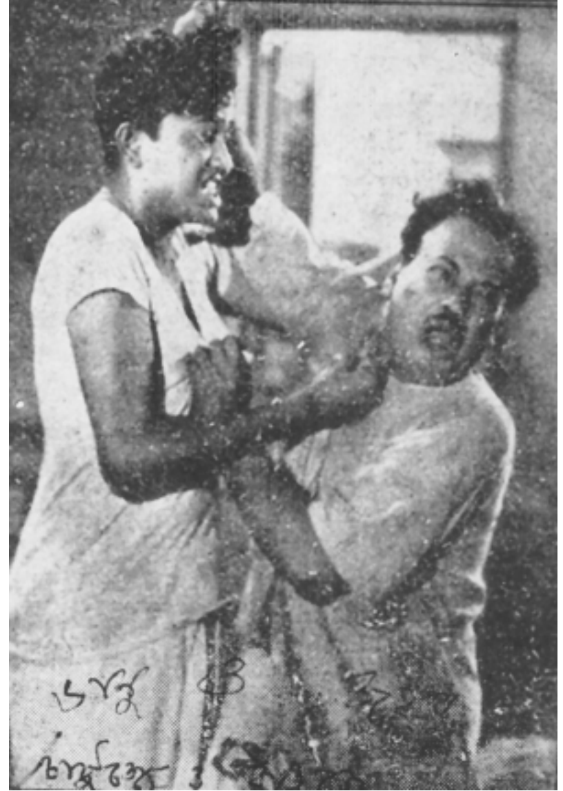
চট্টো ও বাঁড়ো: ১৯৫৫