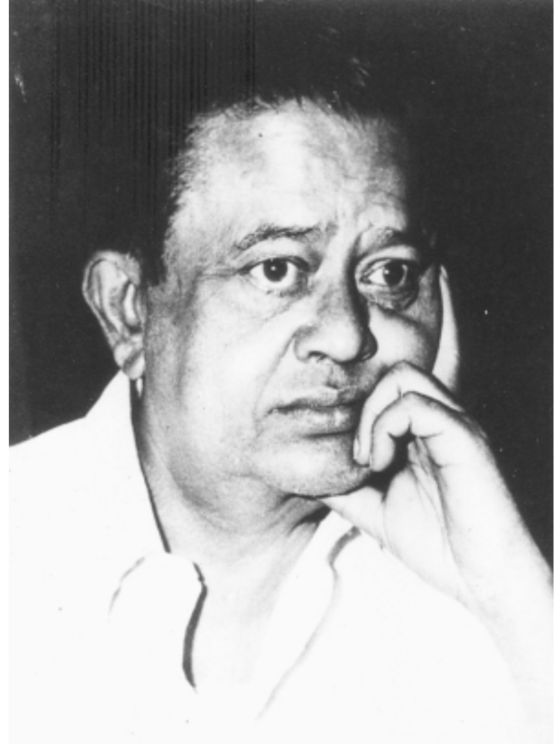
একটি বিশেষ মুহুর্তে ভানু