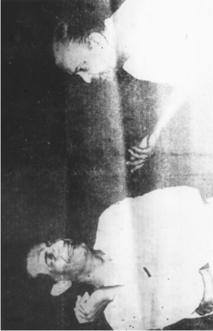
ওপি গাইন বাঘা বাইন (১৯৬৯) প্রথম দিনে সভাজিৎ ও ভানু