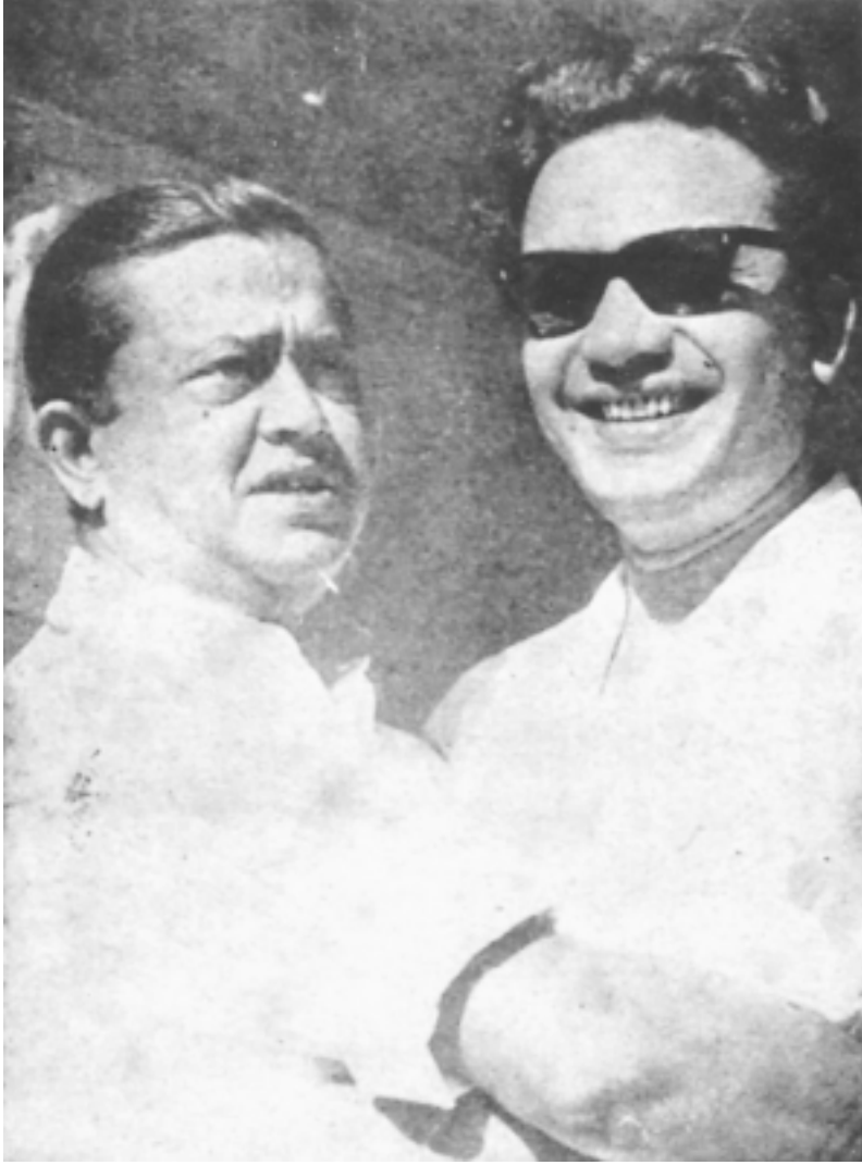
সখের চোরের গুটিংয়ে: ১৯৫৮

না। এই জাতের সহশক্তি একমাত্র বিপ্লবীর মধ্যেই দেখেছি। অবাক লাগে যখন বেশ কিছু গুণিজনের মুখে উত্তমের সঙ্গে তাঁর পূর্বসূরিদের তুলনা করতে শুনি। আমার স্থির বিশ্বাস, সে আজ বেঁচে থেকে যদি একথা শুনত, সব চেয়ে বেশি আঘাত পেত। কারণ যে কোনও অভিনয়েতেই ওকে বলতে শুনেছি, এটা ওমুকের ওমুক বই থেকে নেওয়া, ওই জায়গাটা ওমুকের ওই বইটা থেকে নেওয়া। এটা তার সঙ্গে যারা কাজ করেছে তারাই জানে। অনেককেই বলেছে একটা বইয়ের বিশেষ একটা জায়গা ভানুদা বলে দিয়েছিল। তাহলেই দেখুন ও সমগোত্রীয়দের স্বীকার করত। সে জানত পূর্বসূরিদের শ্রদ্ধা করতে, জানত সমগোত্রীয়দের সঙ্গে সখ্য করতে। পূর্বসূরিদের উজাড় করা ভালবাসা, আশীর্বাদ সে পেয়েছিল তাই উত্তম— উত্তম।